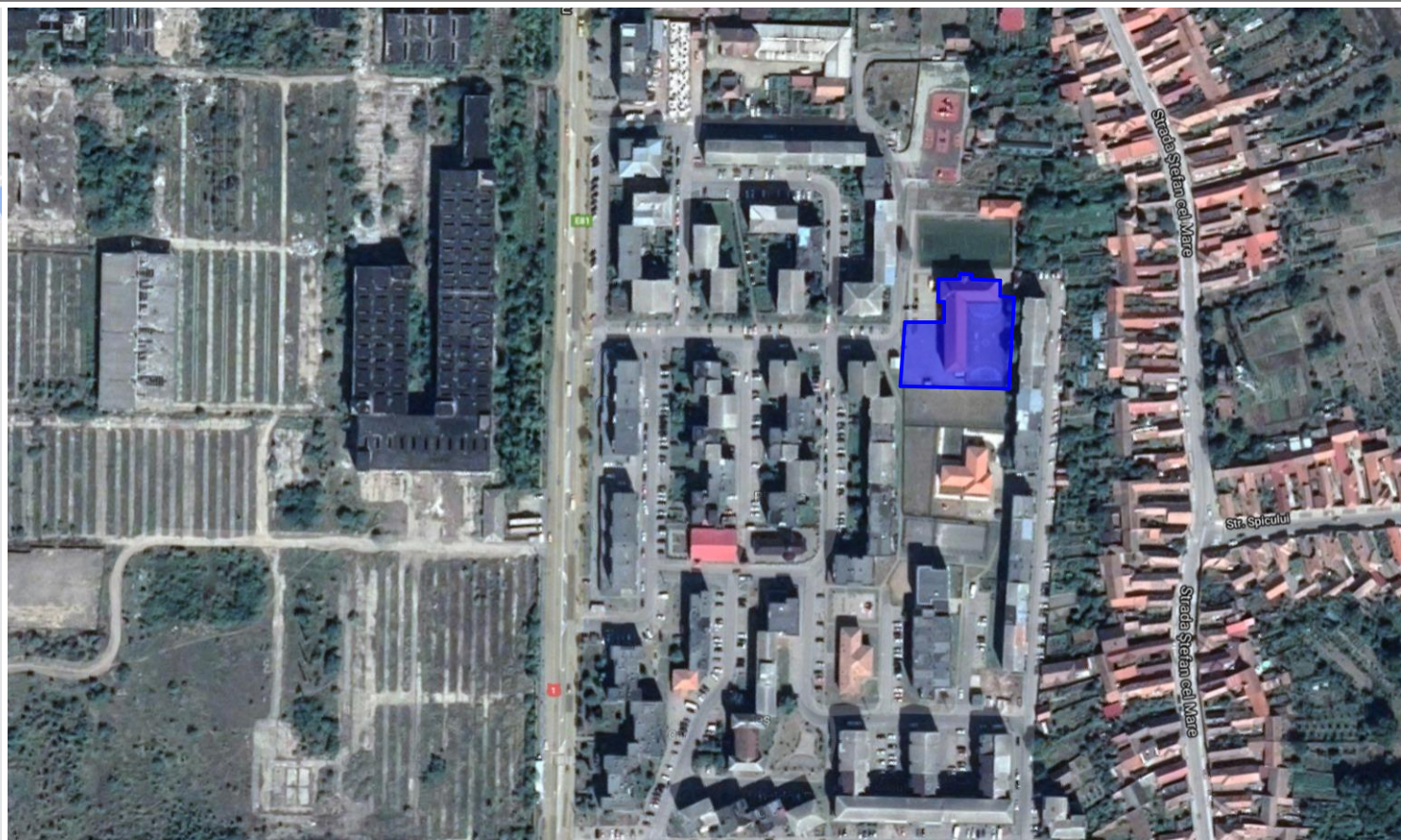
Incadrare in zona